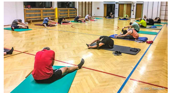
Schigymnastik „Fit in den Winter“

Zu Vorbereitung auf den Winter bietet der Verein jedes Jahr ab Oktober eine Schigymnastik für Erwachsene (Fit in den Winter) und Kinder (Fit in den Winter KIDS) in der Turnhalle Treubach an. Auch hier kommen ausgebildete Trainer zum Einsatz.