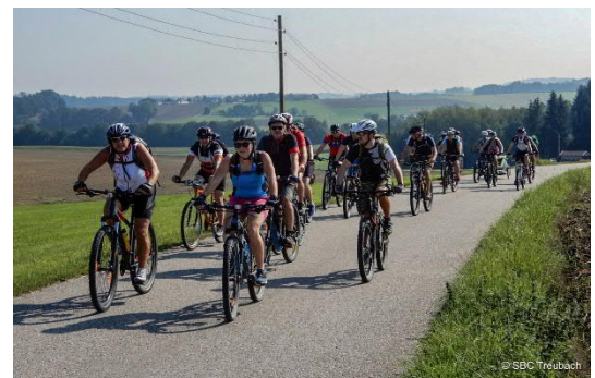
Radausflug des SBC-Treibach

Seit einigen Jahren ist der Verein nicht nur im Wintersport aktiv. Wir bieten im Sommer regelmäßige Mountainbiketouren in Treubach und Umgebung an. Schließlich ist die Gemeinde Treubach Teil der „KTM Kobernaußerwald MTB-Arena“. Radausflüge für jedermann, etwa nach Salzburg ins Bräustüberl oder Bergwanderungen runden das Programm im Sommer ab.