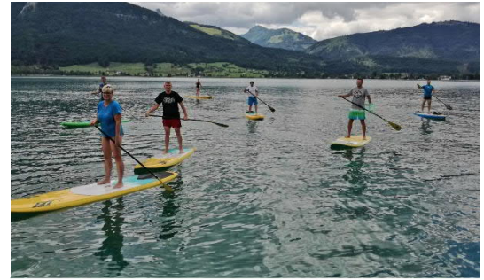
Betreuerausflug an den Wolfgangsee

Der Verein bietet auch seinen Betreuern ein durchaus attraktives Programm. So steht jedes Jahr im Dezember eine zweitägige Betreuerfahrt am Programm. Unter Anleitung von InstruktorInnen kann jeder Betreuer sein Können individuell verbessern, um dies dann im Schikurs weitergeben zu können. Weiters können über den Verein verschiedenste Ausbildungen, etwa vom Übungsleiter bis zum Trainer, absolviert werden. Als Dank für ihre Mitarbeit gibt es jedes Jahr einen gemeinsamen Ausflug für die Betreuer.