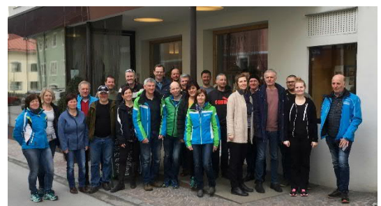
Mehrtageschifahrt 2019 nach Matrei in Osttirol

Die Wintersaison wird abgerundet durch gemeinsame Ausflüge zu interessanten Veranstaltungen, wie etwa alpine oder nordische Schiweltmeisterschaften oder einzelne Weltcuprennen.